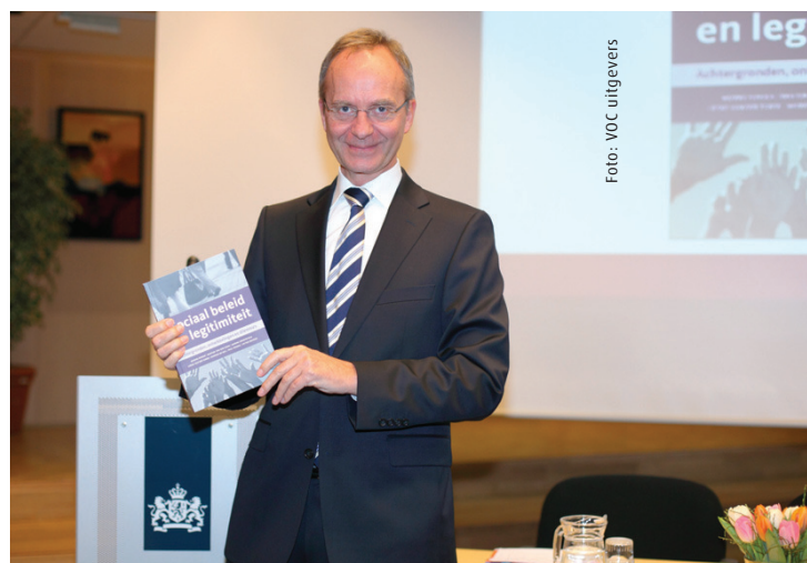
'Verplichte kost voor beleidsmakers'

Burgers hebben verschillende voorkeuren en belangen. In sommige gevallen zijn bepaalde voorkeuren en belangen over- of ondervetegenwoordigd, waardoor het gevaar bestaat dat deze niet in de juiste verhoudingen worden verwerkt in beleid. De onderzoekers nemen de onderhandelingen over CAO's en pensioenen als typisch voorbeeld. De overheid zou volgens hen in beleids(her)vorming meer